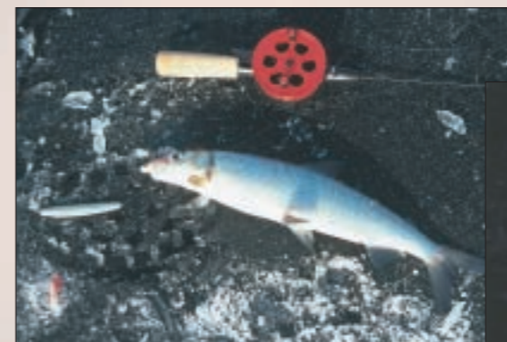
Teho pimpelspöt och en blank Bergmanpirk var en helt perfekt kombination på Vätterns sikar..