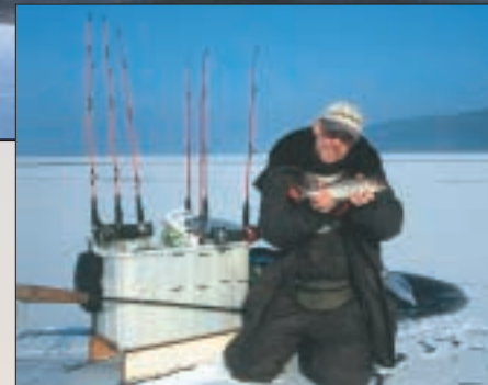
Min första pimpelsik någonsin, Bergmanpirk med kort nylontafs och räka var dagens melodi...

Våran härliga och vindstilla dag gick mot sitt slut och vi kunde summera till ca 20 sikar som vi lyckades lura och lirka upp