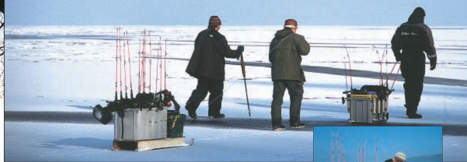
Med fullt lastade ismeteslädor var vi äntligen på väg mot sikarna ...