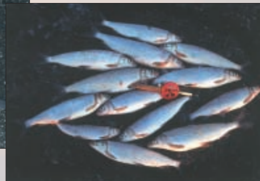
Siken nappade på mellan 17 - 22 meter djupt vatten, prova gärna räka om du ska fiska sik..