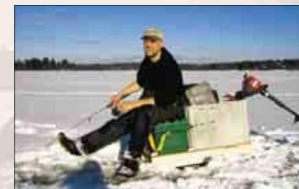
Pimpelfiske efter gädda och gös är jättespännande, huggen är ofta stenhårda.