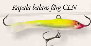
Rapala balans färg CLN

mycket bra på grov abborre. Ibland händer det att man även får havsöring på pimpelfiske och för några år sedan fick jag min bästa pimpelfisk hittills. Det var en grann havsöring på 3.980 kg och den fina fisken tog en 5cm Rapala balanspö i färgen CLN, (clown).