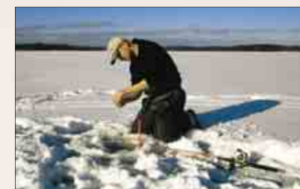
När solen lyser är det härligt att vara ute på isen, en vindstilla dag är det helt underbart.