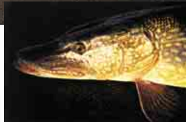
Vid ismete efter gös nappar det nästan alltid glupska gäddor.

rar jag storlekarna på 3 cm, 6 cm och 7 cm, som är lagom för storabborren. Till gösen och gäddan tar du de två största storlekarna. Några av mina favoritfärger är bl.a. "abborre", silver/blå och "Firetiger". Abborren kan vara riktigt selektiv och vissa dagar fungerar inte dessa färger alls varvid man måste pröva sig fram till rätt färg för dagen. Pimpla inte hysteriskt utan gör uppehåll mellan rycken så att fisken har en möjlighet att nappa. Ofta brukar det löna sig att skaka lite på spötoppen så att balanspirken vibrerar i vattnet. Pröva gärna att variera fiskedjupet också från botten och speciellt på vårisarna då storabborren ofta hittas under iskanten. Även Storm balansjiggen fiskar förföriskt och har vid testfiske fiskat