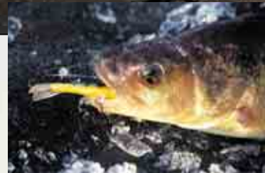
En Rapala balanspö är en av de klart bästa pöarna för storabborren.